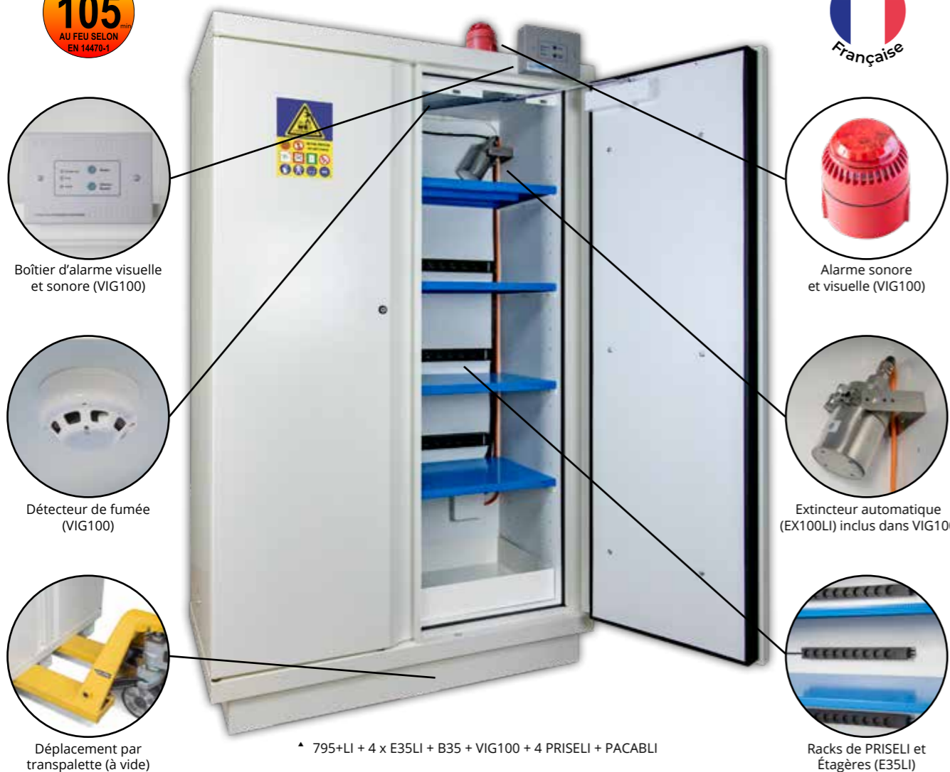
Boîtier d'alarme visuelle et sonore (VIG100)