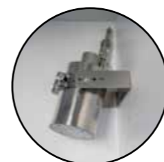
◀ Extincteur automatique à ampoule 79°C (EX100LI)